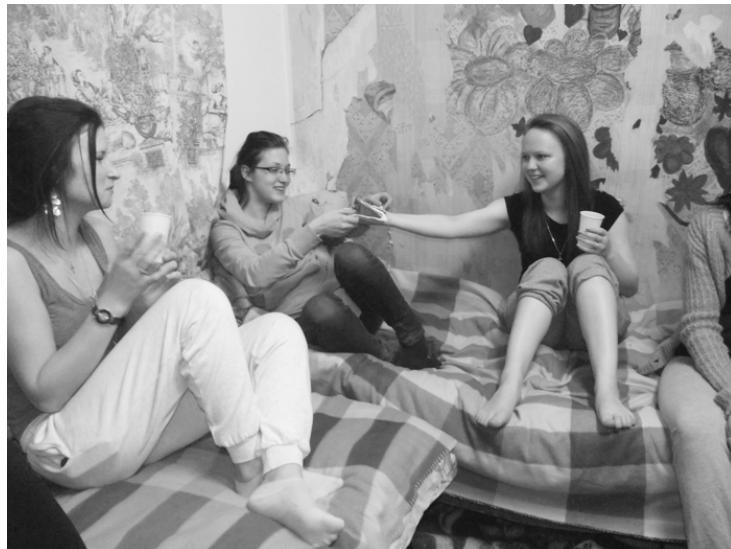
STUDENTI MAINĀS, BET SIENAS PALIEK

Tomēr diskusiju laikā bija arī labas ziņas. Iepriecināja dzirdētais, ka beidzot skolas vadība dienesta viesnīcas sakārtošanai ir atvēlējusi krietni lielāku budžetu, un, ja ticam solījumiem, pēc dažiem gadiem LiepU studenti varēs dzīvot izremontētā un labiekārtotā dienesta viesnīcā.