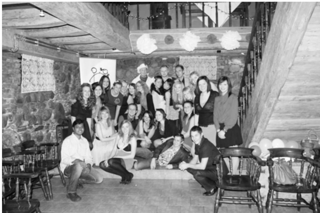
STUDENTU PADOME UN VIESI

Svinīgās daļas izskaņā viesi tika aicināti pie uzskatu galda. Vakara gaitā studenti varēja kavēties atmiņās (īpaši šim vakaram bija izveidota foto siena) par piedzīvoto vairāku gadu garumā. No plkst. 22.00 viesus izklaidēja muzikālā apvienība „Duets”.