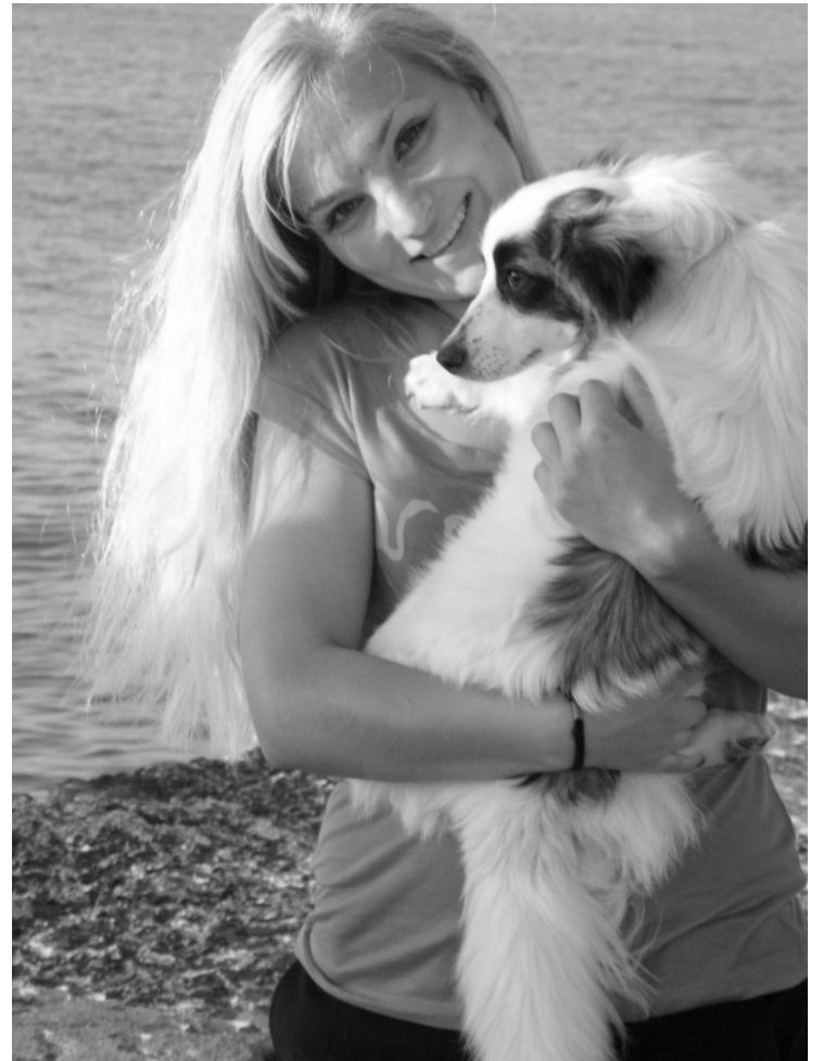
ELITA AR SAVU SUNI VINNIJU