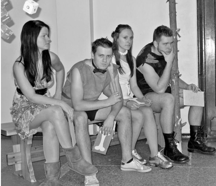
FUKŠU ORGANIZATORI UN ŽŪRIJA

Atsauksmes? Pozitīvas! Pirmkursnieki ir sajūsmā un pateicas Liepājas Universitātes Studentu padomei un otro kursu studentiem par to, ka kļuvuši īsteni fukši!